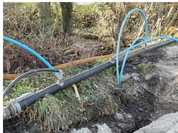
Den anden ende kobles på pumpe­slangen, og vandet sendes ud i havet.