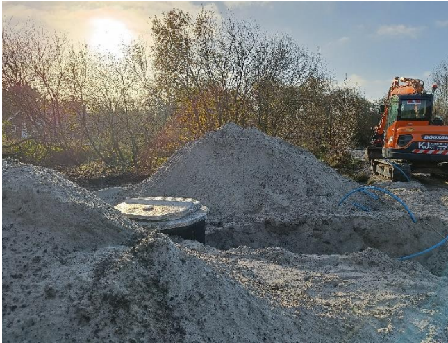
Samlebrønden på Vesterengen