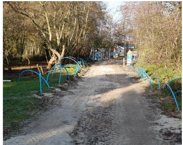
Grøndalvej mod Vesten Bavn