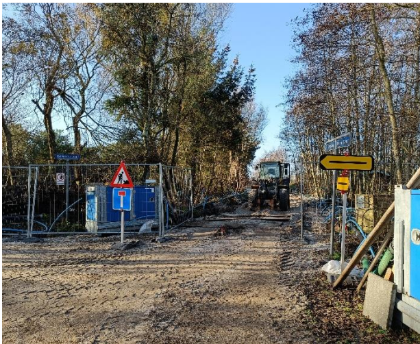
Et lille stykke af Grøndalvej set mod Vesterengen, og Grøndalvej til venstre

Det er svært at se det bliver til vej igen. Men bare rolig, alt bliver som før.