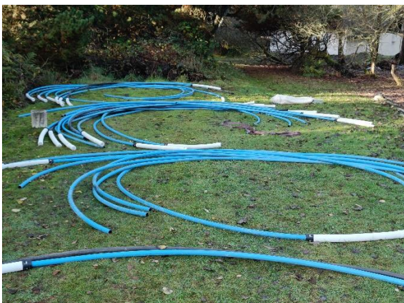
Rør der bruges til grundvandssænkning, det hvide filter stikkes i jorden og suger vandet.