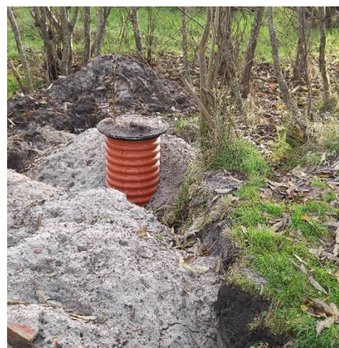
Hver grund sin målerbrønd 1 m inde på grunden