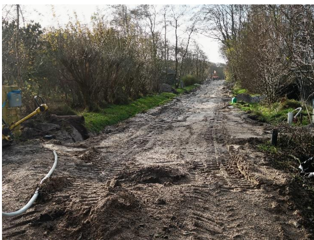
Vesterengen Hvor der ikke er adgang for tiden.

Flere veje er nu gravet op, og der er en del omkørsel.