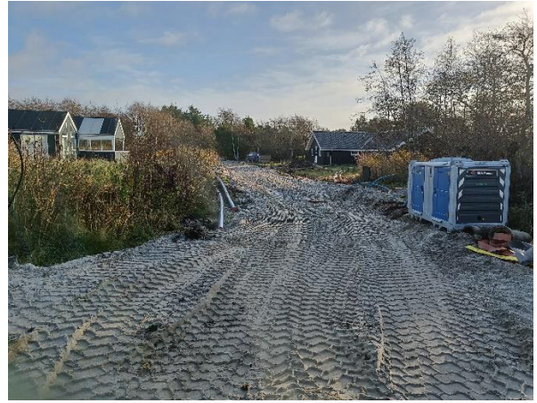
Grøndalvej set fra Vesterengen, hvor der ikke er adgang for tiden.

Det er svært at se det bliver til vej igen. Men bare rolig, alt bliver som før.